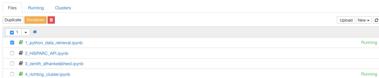
Figuur 2.2 – ‘Python data retrieval’ is in het ‘Home’-tabblad geselecteerd. De selectie is nu te dupliceren, af te sluiten of weg te gooien.

In de home-pagina werkt ‘1_python_data_retrieval’ als een link. Als we er op klikken, opent een nieuw tabblad.