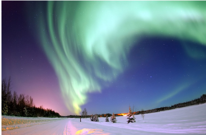
Figuur 1.1 – Poollicht boven Alaska [1].

E_0 = 105,6 \text{ MeV} . Voor een deeltje dat beweegt met snelheid v is de energie groter: